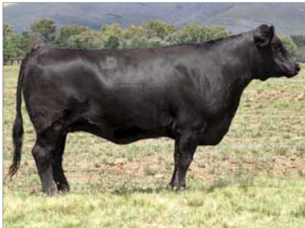
RP 424. Madre del 6655 y 6659.