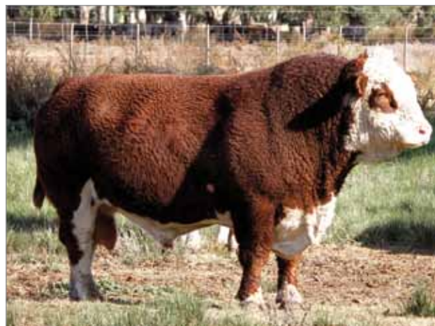
Batido. Abuelo materno del X5065.