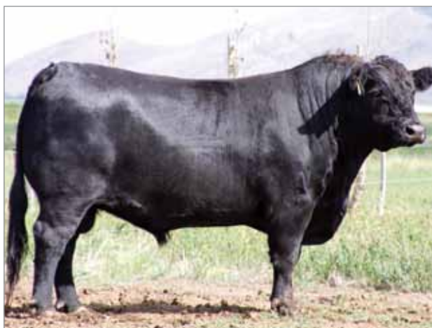
Chamigo. Padre del 6857.