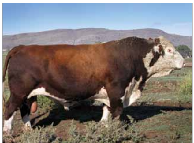
Payaso. Abuelo materno del X4931.