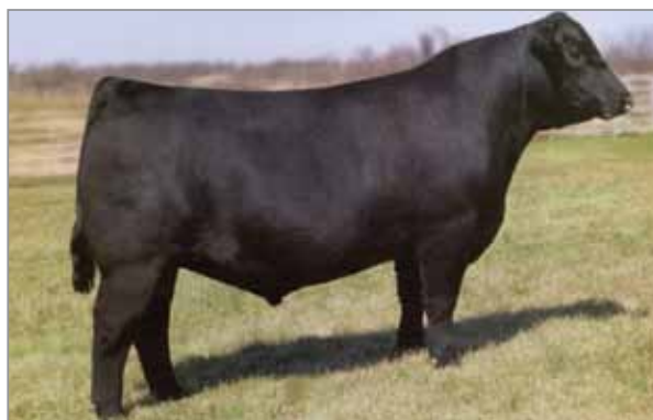
Brilliance. Abuelo materno de Impacto.