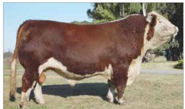
Federal. Padre de Fama.