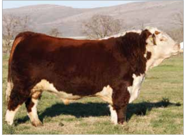
Imperial. Padre del X4909, X4913, X4917 y X4925.