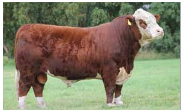
Mosquito. Padre de Quillay y del X5129.