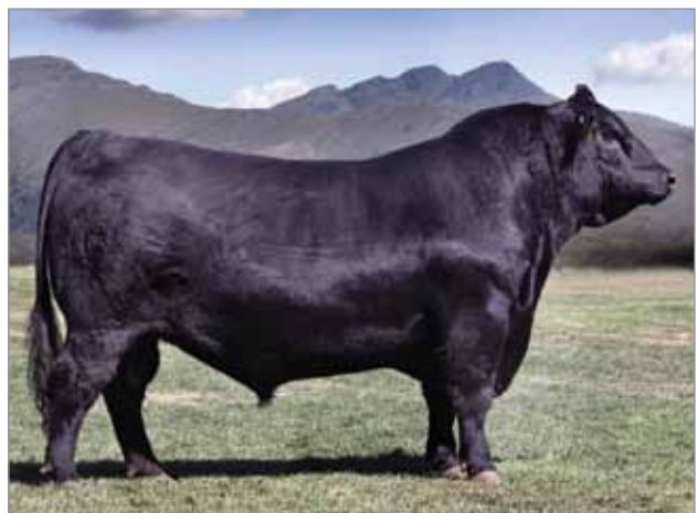
Rafi. Abuelo materno del 6717.