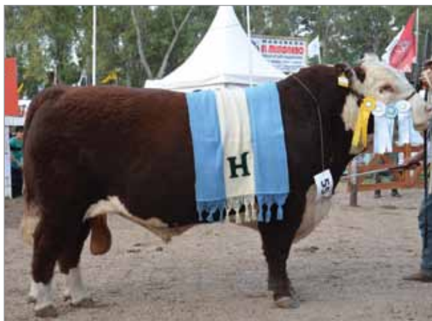
Yatasto. Gran Campeón Nacional 2011. Abuelo materno del X5051.