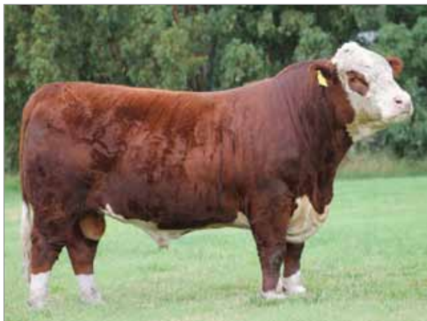
Mosquito. Padre del X4897, X4905 y X4931.