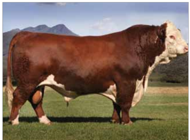
Fanático. Abuelo materno del X5039.