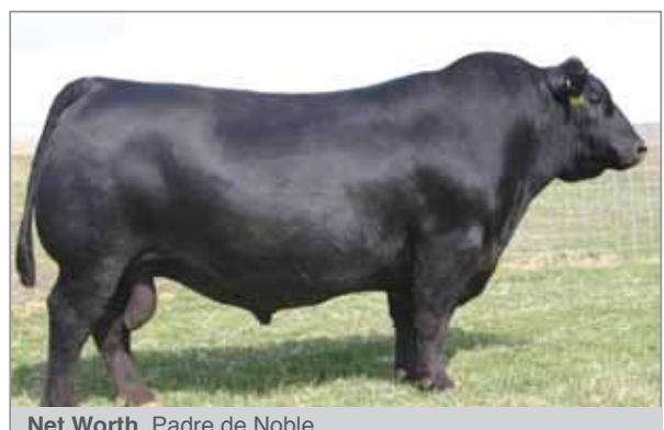
Net Worth. Padre de Noble.