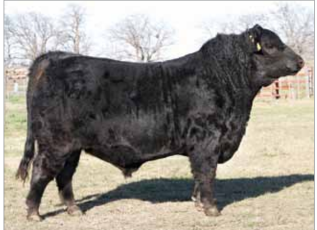
Bellaco. Padre del 7099.