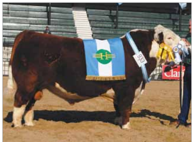
Mustang, Gran Campeón Palermo 2009. Padre del X5041.