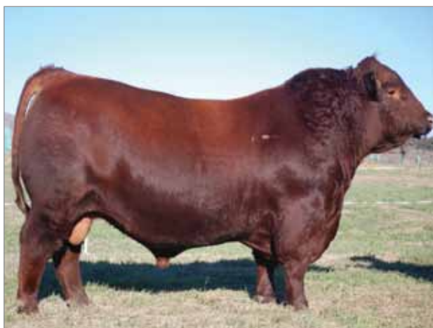
Cumpa. Padre del 6859.