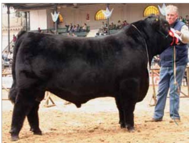
Topador: Rdo. Campeón Jr. Palermo 2008. Abuelo materno del 7025.