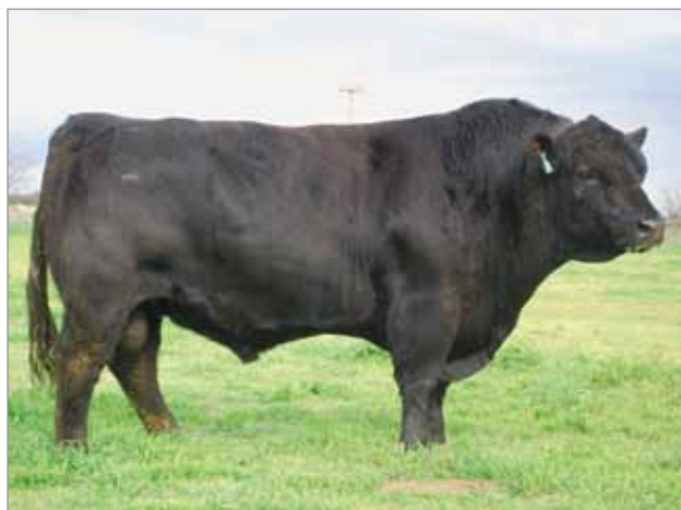
Gendarme. Padre del 7091.