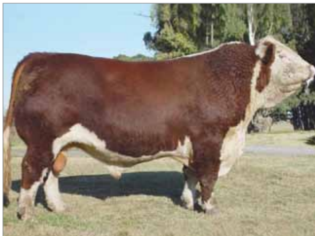
Federal. Padre del X5115, X5117 y X5127.