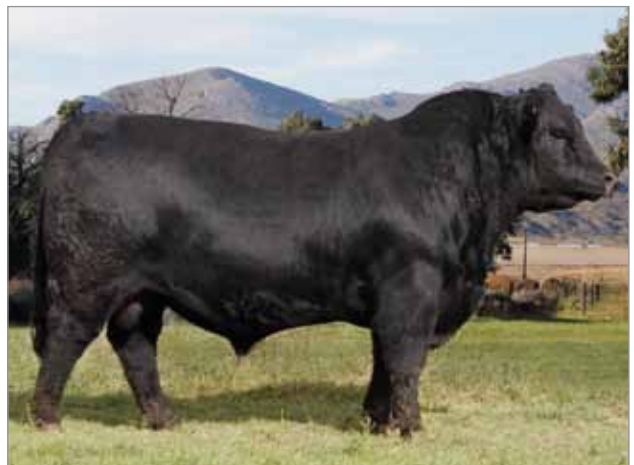
Cosaco. Padre del 6787.