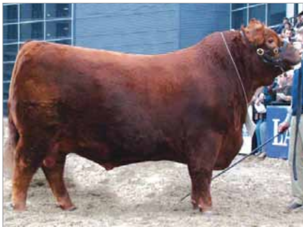
Quebrantador. Abuelo paterno del 6745.