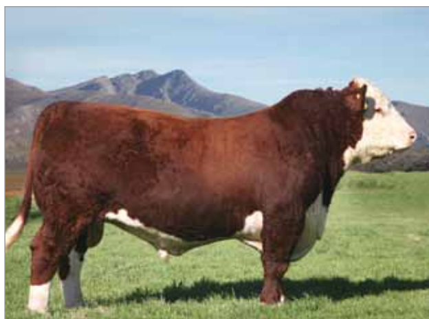
Ombú. Abuelo materno del X4973.