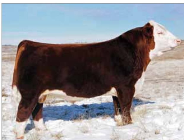
About Time. Abuelo materno del X5055.