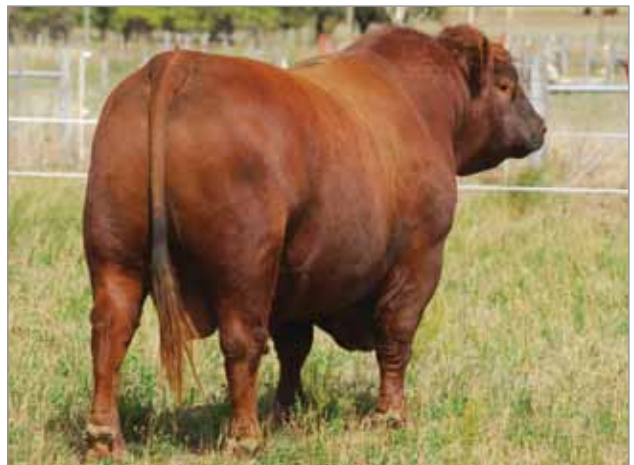
Luque. Padre del 6793.