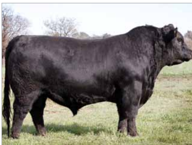
Speedy. Abuelo materno del 7057.