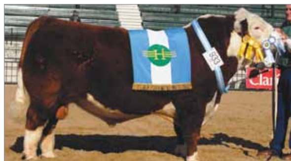
Mustang, Gran Campeón Palermo 2009. Abuelo paterno de Avispa y de Águila.