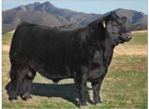
Cóndor. Abuelo materno del 6811.