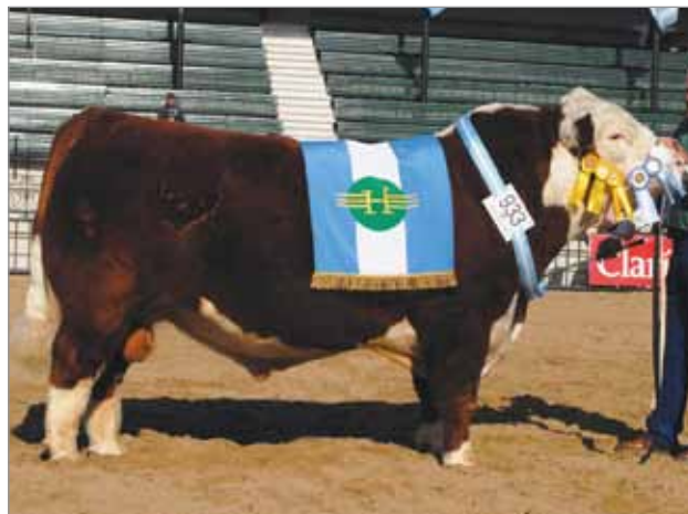
Mustang, Gran Campeón Palermo 2009. Abuelo materno del X4943.