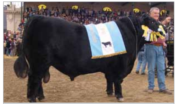
Facón. Padre de Farmer.