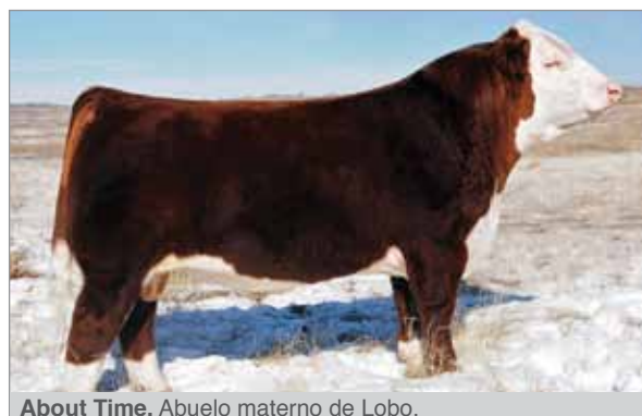
About Time. Abuelo materno de Lobo.