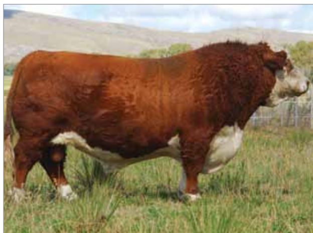
Safari. Padre del X4881 y X4883.