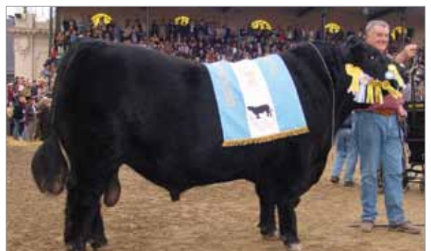
Facón. Abuelo paterno de Gaita.