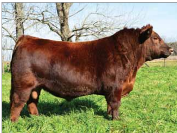
Pueliche. Padre del 7071.