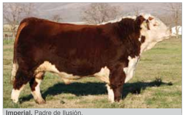
Imperial. Padre de Ilusión.