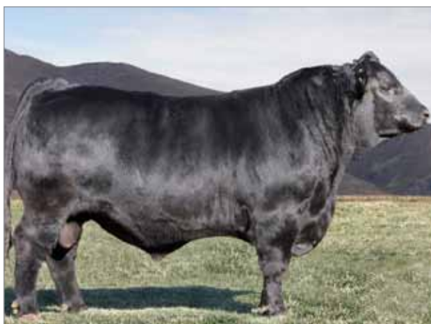
Spooky. Abuelo paterno del 7135.