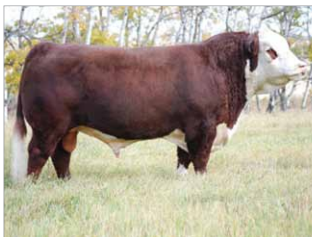
WLB 50S. Abuelo paterno del X4957.