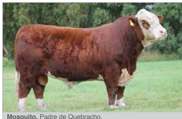
Mosquito. Padre de Quebracho.