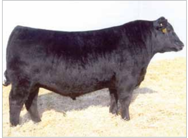
S A V Free Spirit 8164. Abuelo materno del 7027.