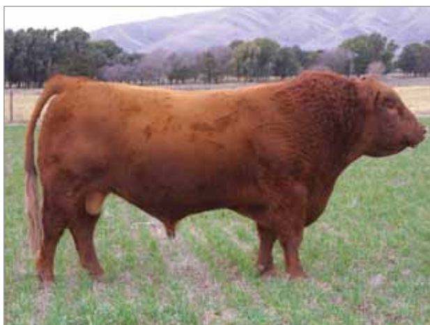
Compadre. Abuelo materno del 6977.