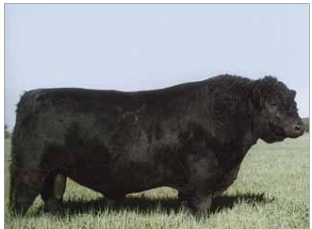
Líder. Abuelo materno del 7177.