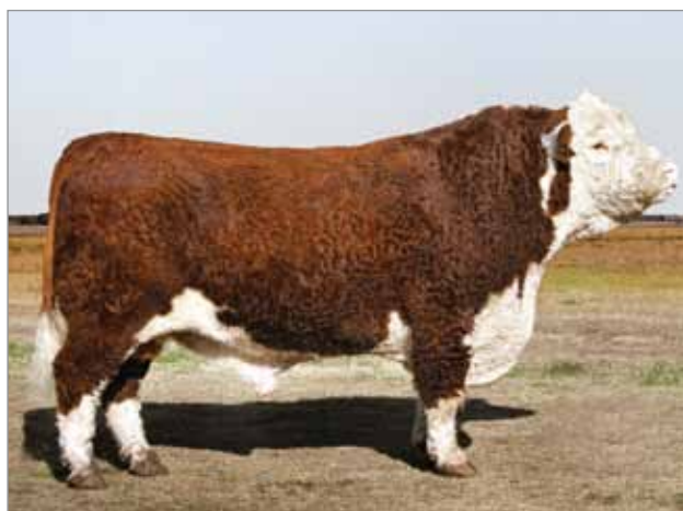
Invasor. Padre del X5019 y abuelo materno del X5013.