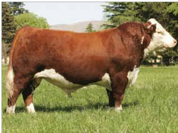
Caruso. Abuelo materno del X4963.