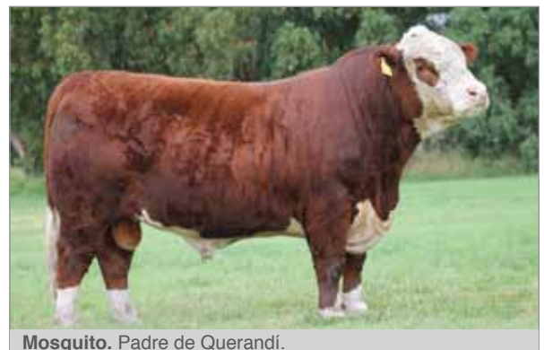
Mosquito. Padre de Querandí.