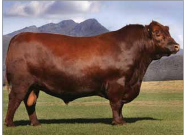
Apache. Abuelo materno del 7915.