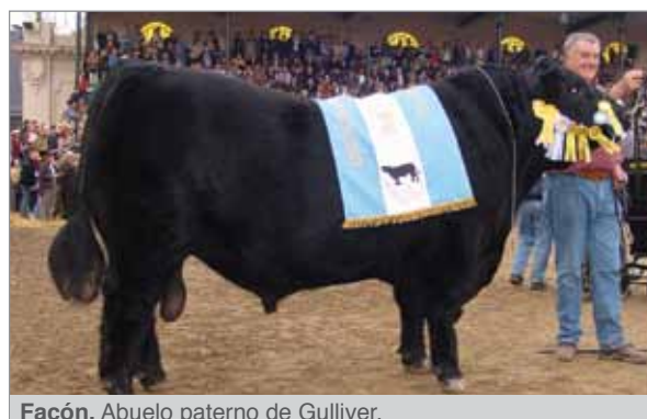
Facón. Abuelo paterno de Gulliver.