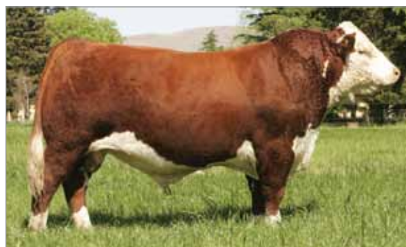
Caruso. Abuelo materno de Lotus.