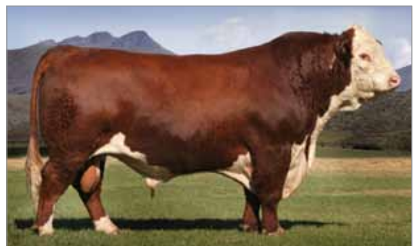
Fanático. Abuelo materno de Avispa y de Águila.